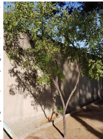
درخت عناب چندساله واقع در بوستان حضرت نجمت قم منطقه ۷