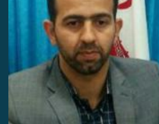
روح الله امراللهی رئیس کمیسیون عمران و حمل و نقل شورای اسلامی شهر قم

شهر قم به عنوان یکی از شهرهای مذهبی مطرح جهان نیازمند توجه ای ملی در توسعه است. ورود ۲۰ میلیون زائر ظرفیتی است که باید از آن در جهت تحولات اقتصادی بیشترین بهره رابد. بستن رودخانه قمرود و کوهستان هزار هکتاری قم دو ظرفیت طبیعی شهر بوده و باید از این دو ظرفیت طبیعی در جذب توریسم و افزایش ماندگاری مسافر و توسعه اقتصادی شهر استفاده کنیم. کاشت گونه های مختلف گیاهی سازگار می تواند تأثیر بسیار زیادی در کیفیت اقلیم قم داشته باشد و سرانه فضای سبز شهر را نیز بهبود بخشد. ایجاد کاربری های تفریحی و توجه به اشتغال زایی و جذب توریسم یکی دیگر از مسائلی است که در طراحی بوستان هزار هکتاری مورد توجه بوده است. عملکرد سازمان پارک ها و فضای سبز شهرداری قم در بوستان هزار هکتاری و توسعه فضای سبز شهر قم قابل توجه و مثبت است و شورای اسلامی شهر قم با حمایت کامل از این بوستان به صورت جدی پیگیر تمام آن خواهد بود.