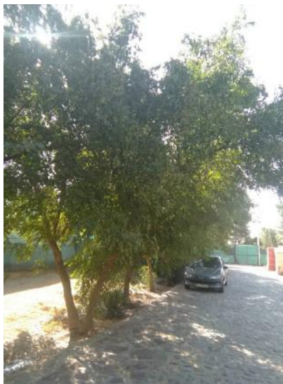
درختان عناب چندساله واقع در بوستان غدیر قم منطقه ۸

عناب از خانواده Rhamnaceae درختی است به ارتفاع ۸ تا ۱۲ متر که رنگ تنه ی آن قهوه ای تیره بوده و در طول آن ترک های عمودی به چشم می خورد. برگ های درخت کم و بیش بیضی شکل، ساده و تا حدودی دنداندار است که به طور متناوب نسبت به یکدیگر روی ساقه قرار می گیرند. گل های آن کوچک و زرد رنگ هستند و میوه اش از نوع شفت، تقریباً کروی شکل و قطر آن ۱.۵ تا ۲ سانتی متر می باشد. رنگ میوه ابتدا سبز است که رفته رفته زرد شده و در هنگام رسیدن به رنگ قرمز تیره تبدیل می شود که رنگ خاص عناب است و اصطلاحاً عنابی نامیده می شود که بعد از رسیدن ریزش می کند. (کافی و همکاران، ۱۳۹۴) گوشت میوه شیرین و ترد است، میوه به صورت تازه یا مرصاف خوراکی دارد. در مناطق مناسب، درخت در دو سالگی میوه می دهد. سیستم ریشه ای این گیاه عمیق و سرعت رشد آن متوسط می باشد. (روحانی، ۱۳۹۴) گرچه در ایران کشت عناب در بیشتر استان های کشور به صورت پراکنده دیده می شود ولی استان خراسان جنوبی بیشترین سطح زیر کشت را دارد. (Ghouth, ۲۰۱۱) میوه عناب در